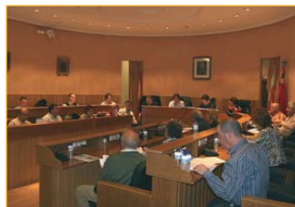
◆ Consejo de Participación.

Ahora los vecinos están recibiendo cartas en las que podrán hacer sus aportacio-