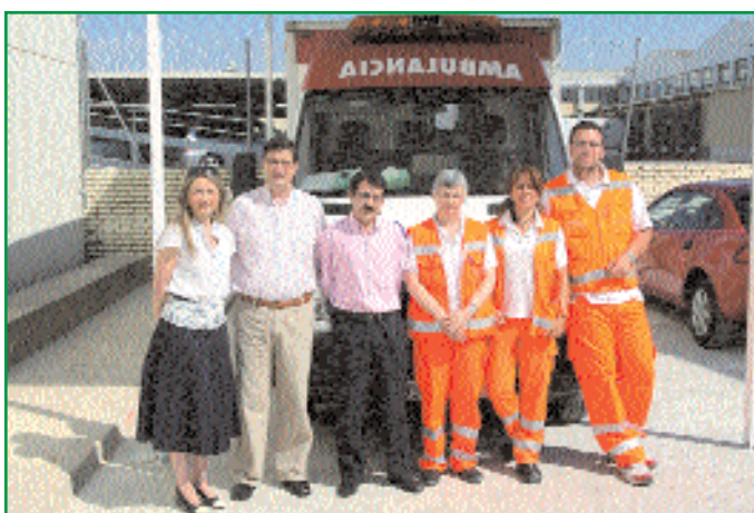
◆ La concejala de Sanidad con el equipo que atiende la SAMU.

De forma paralela, Paterna ha introducido criterios sociales en la contratación de personas por brigadas de apoyo, de forma que puntúa la situación familiar y tiempo en paro, a la hora de hacer los contratos.