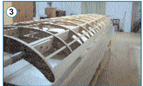
❖ 1. La maqueta del Bleriot. 2. Pruebas y planos de la construcción. 3. Esqueleto del ala izquierda del avión. 4. Traslado desde Canet a una nave de Quart de Poblet. 5. El avión ya construido. 6. El alcalde visita a la Casa Real para invitarles a los actos del centenario.