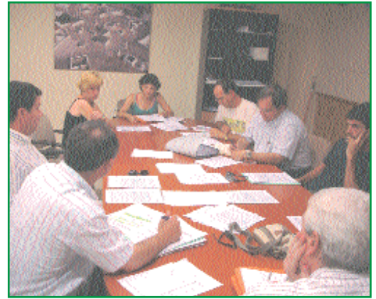
➡ A la izquierda, supervisión antes de las talas. A la derecha, reunión de la comisión de talas.