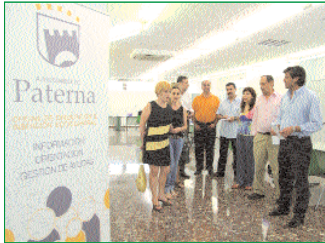
◆ La oficina que presta el servicio integral.

La rehabilitación del casino de la Plaza del Pueblo dará empleo y formación a otros 36 jóvenes durante dos años. Pasarán los seis primeros meses recibiendo una beca por el período de formación, mientras que los restantes 18 meses lo harán con un contrato laboral.